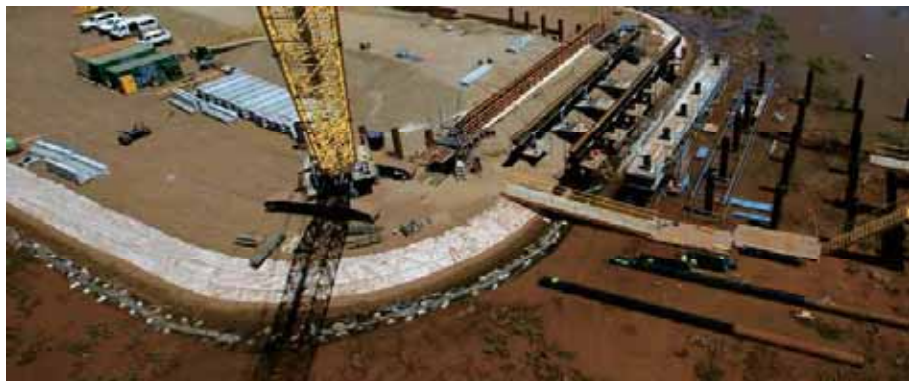
> 鸟瞰软土上的基底加筋

基底加筋的运用使得在淤泥上建造路堤路基能够更加迅速直接而无需进行软土置换，因此，对环境的影响也降低到最小。这个服务通道也能够按时竣工。此外，这个路堤的沉降值也控制在预计的250mm以内。