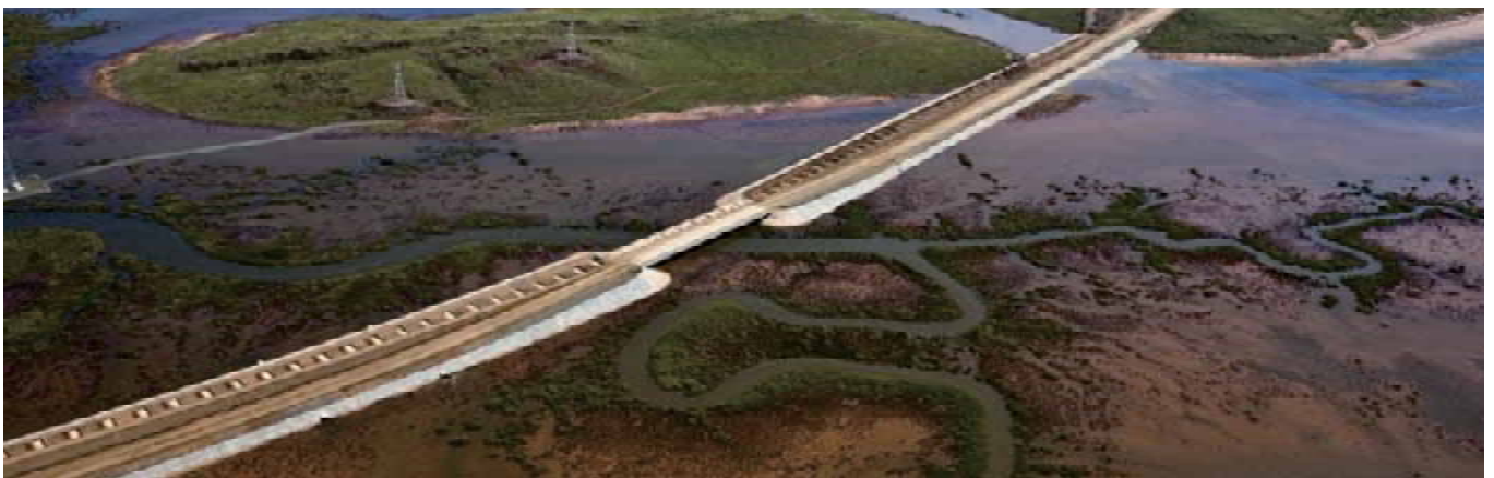
> 鸟瞰竣工的路堤基底加筋